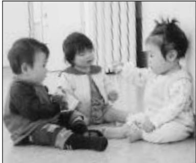
▲写っている方に写真または画像データを差しあげます。企画調整課まで。