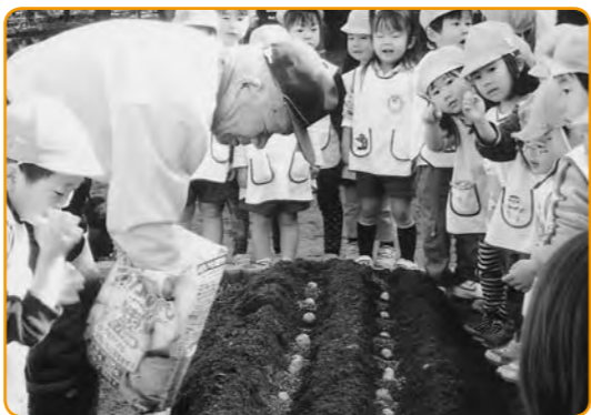
▲これからも優しく育てようね