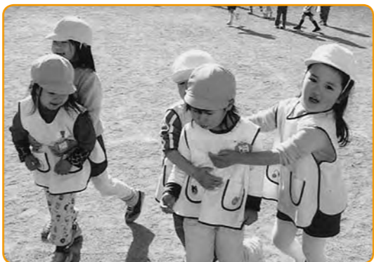
▲ワニになってはさみうち!