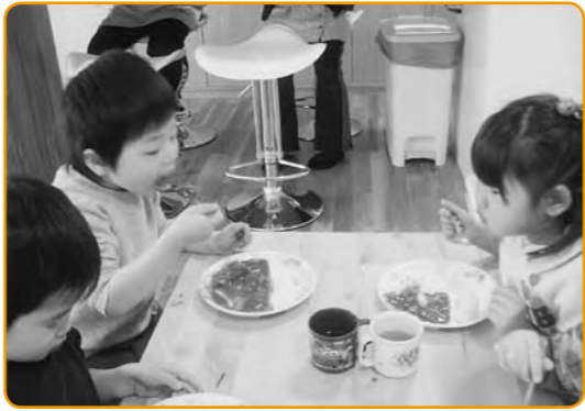
▲大～きな口をあけて、パクッ!!