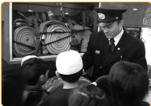
▲「ポンプ車」には何があるのかな?