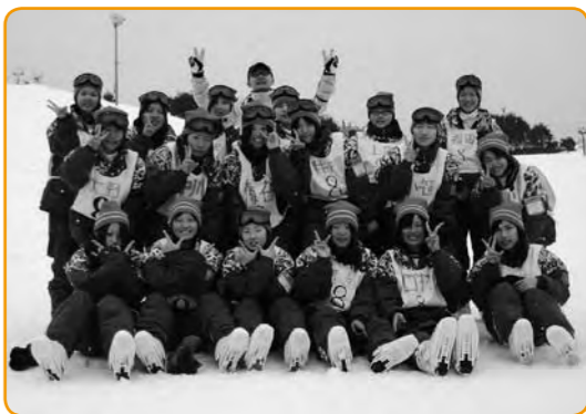
▲スキー最高! ニカッ!