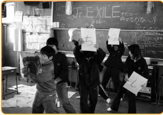
▲文字を読み取って、言葉にしてみよう