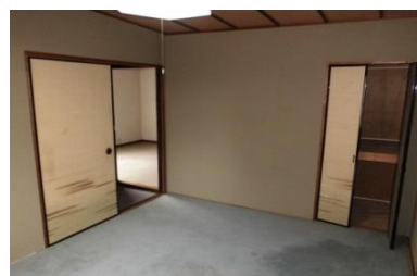
2階(畳)敷カーペット