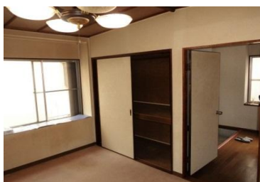
1階(フローリング)敷カーペット